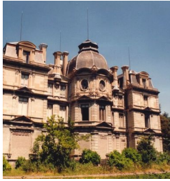
Ci-contre : le château Dorian en juin 1994

Ce court texte fait suite à une visite du château Dorian en 1994, alors que l'avenir de la bâtisse était pour le moins incertain. L'objectif était alors de fixer le souvenir de cet édifice avant que les outrages des hommes et du temps n'en viennent définitivement à bout.